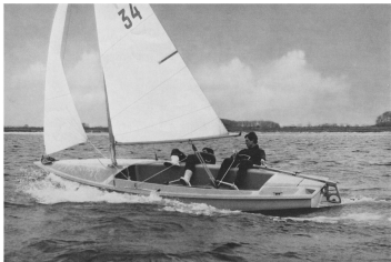
„NEPTUN 17“ bei leichtem Wind in Gleitfahrt